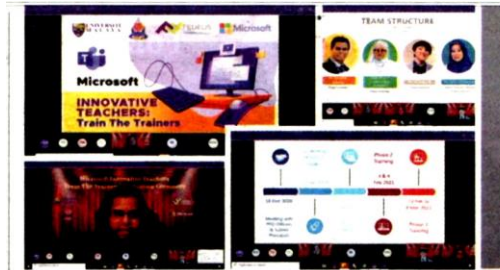
Program yang dianjurkan Universiti Malaya itu bagi memberi pendedahan kepada guru dengan teknologi terkini.