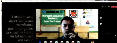
Latihan yang diberikan akan membantu guru mengatasi kesukaran ketika melaksanakan sesi PdPR.