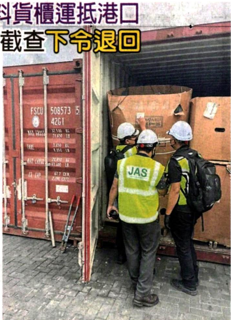
■雪州环境局截查2个装有电子废料的货柜。

从今年1月至7月，雪州环境局已下令将90个货柜，装有1750公吨，价值631万令吉的电子废料退回原产国，该局致力于打击跨境的环境犯罪，防止雪州沦为外国倾倒废物的地点。